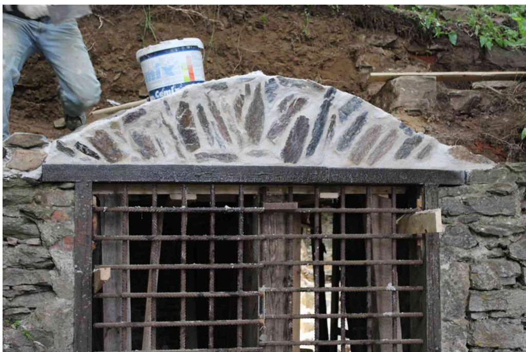
Provádění výkopů podlahy sklepa